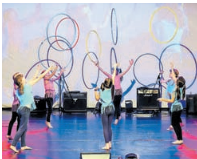
Plesni nastop ob skladbi Sreča na vrvi