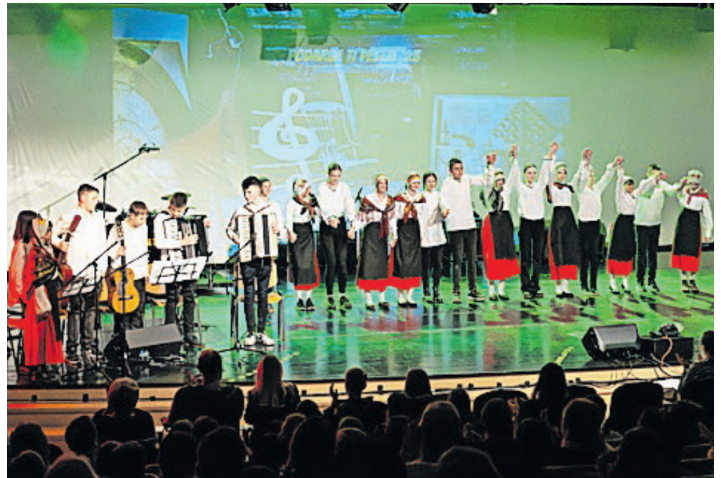
Nastop gostov iz Sarajeva