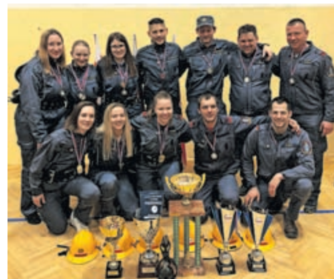
Ekipi članic in članov PGD Zalog. Članice so prejele pokal in prehodni pokal za 1. mesto na tekmovanju, 1. mesto v skupnem seštevku gorenjske lige in pokal za najhitrejši čas dneva med članicami. Člani so zasedli 2. mesto na domačem tekmovanju.

Na tekmovanju v spajanju sesalnega voda je poleg znanja pomembna uigranost oziroma hitrost ekipe.