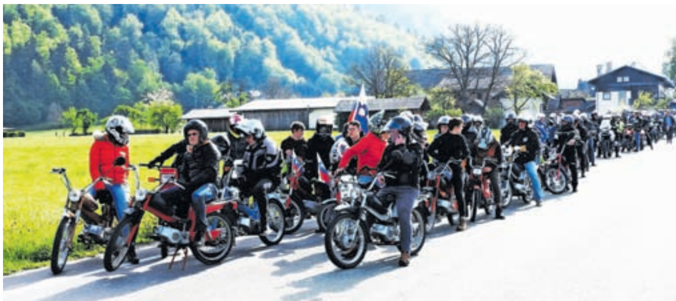
Pred začetkom parade