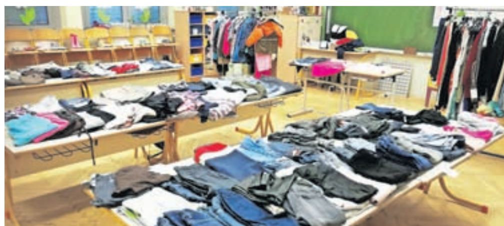
Izmenjevalnica na Osnovni šoli Davorina Jenka

12 kilogramov oblačil. Zato smo v mesecu aprilu organizirali drugo izmenjevalnico oblačil. Tudi cilj Osnovne šole Davorina Jenka je prispevati k manjši obremenitvi okolja in spodbujati kulturo izmenjevanja oblačil. Sodelovali so učenci razredne in predmetne stopnje, povabljeni pa so bili tudi vsi starši in učitelji: »V vsaki omari se najde kakšen kos oblačila, ki ga ne nosimo več in bi ga lahko podarili za ponovno uporabo.«