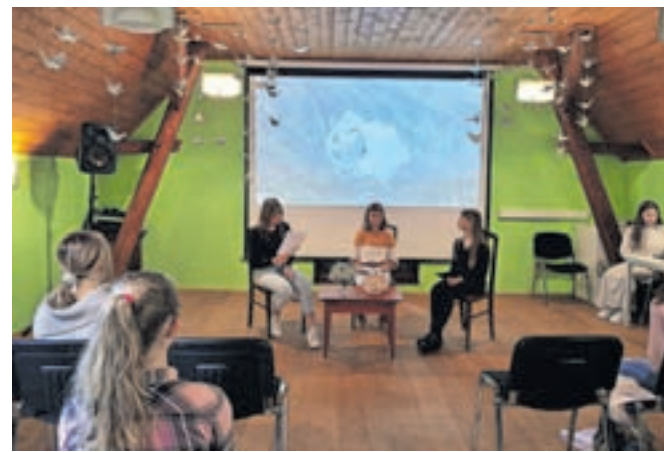
Literarni večer v dvorani na posestvu Strmol