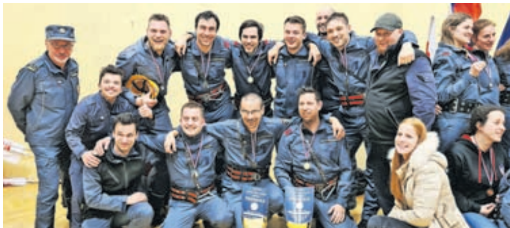
Ekipa PGD Zgornji Brnik A1, ki je bila prva v skupnem seštevku

V ženski konkurenci je bila najboljša domača ekipa, ki je imela najhitrejši čas dneva