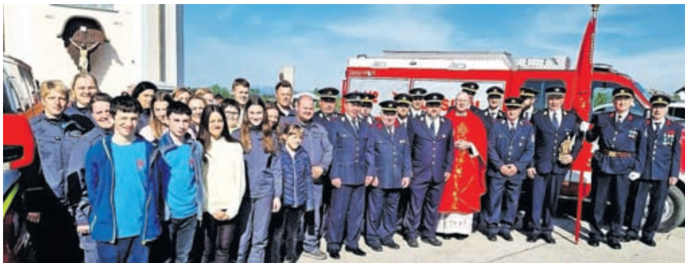
Zbrani pri Florijanovi maši na Spodnjem Brniku

Zgornji Brnik – PGD Zgornji Brnik v soboto, 17. junija, vabi na Curkomet z veselico. »Od 13. ure dalje bo potekal curkomet, proti večeru pa sledi zabava z ansamblom Razgled.«