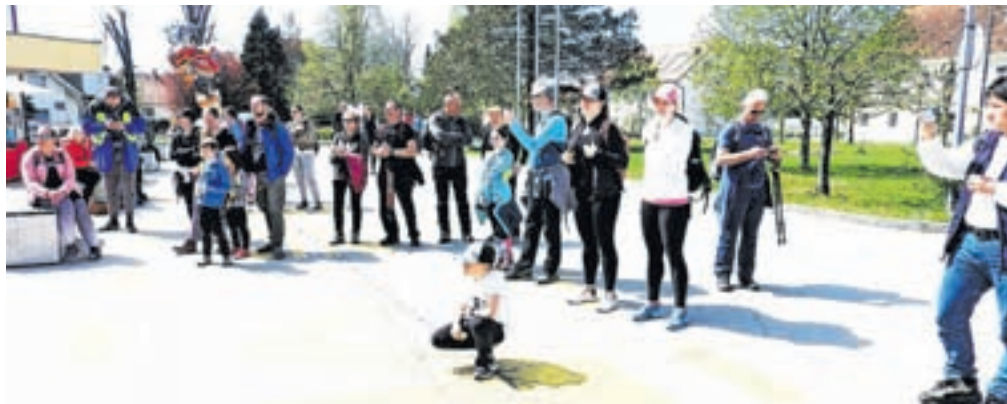
Pohod k sosеду se je zaključil pred osnovno šolo v Cerkljah.

škega igralca, režiserja in pedagoga Ignacija Borštnika ter izvedli še nekaj več o drugih slavnihih možeh iz Cerkelj. Pohod se je zaključil na Cerkljanski tržnici z bogračem, ki so ga za pohodnike skuhal v Planinskem domu v Komendi. Izkupiček pohoda bodo namenili Župnijski karitas Cerklje za prizadete ob potresu v Turčiji. Letošnji pohod k sosеду je bil drugi po vrsti, lani so obiskali Vodice.