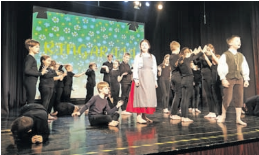
Nastop na Regijskem srečanju otroških folklornih skupin Ringaraja

Cerklje – Trudimo se, da pozabljene običaje, plese in pesmi potegnemo iz zaprte skrinje pozabe, jih oživimo in jim dodamo pridih mladosti. S tem skušamo naše izročilo približati mladim in jim vzbuditi zavest o pomenu njegovega ohranjanja za prihodnje rodove. Velik poudarek dajemo domačemu izročilu, torej gorenjski pokrajini. Nastopili smo na šolskih prireditvah ob počastitvi različnih praznikov, pripravili smo sprejeme in delavnice slovenskih ljudskih plesov in pesmi za otroke in učitelje, ki so prišli k nam v okviru projektov Erasmus+, izvedli delavnice za naše šolarje v okviru projekta Unesco, sodelovali smo z upokojensko Folklorno skupino Cerklje na Večeru folklorne in Skupaj se 'mamo fletno, popestrili smo program ob prevzemu šolskega čebelnjaka in na prireditvi Kulturo šola na ogled postavili. Ponosni pa smo tudi, ker