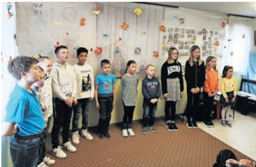
Pomladno obarvana prireditev najmlajših

Prav tako smo s tradicionalnim kurjenjem pusta in velikim rajanjem maškar preganjali zimo in se že veselili tople pomladi. Pričakali smo jo, pomlad namreč, s prireditvijo naših najmlajših in se hkrati spomnili še mamic, očkov, starih staršev in vseh ljudi dobre volje. Tudi ta dva dogodka sta bila v Poženiču.