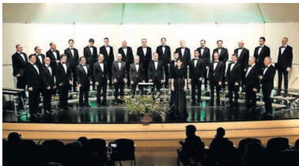
Po uspešno zaključenem letnem koncertu

Pevci Komornega moškega pevskega zbora (KMoPZ) Davorina Jenka so imeli sredi aprila letni koncert z naslovom Si vox est, canta! – Če imaš glas, poj! , v maju pa so zapeli skupaj z Ljutomerskim oktetom.