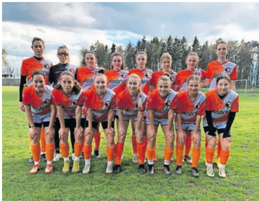
Liga za prvaka Slovenije: dekleta U15

Trenutno smo v sklepnem delu nogometnega in šolskega leta.