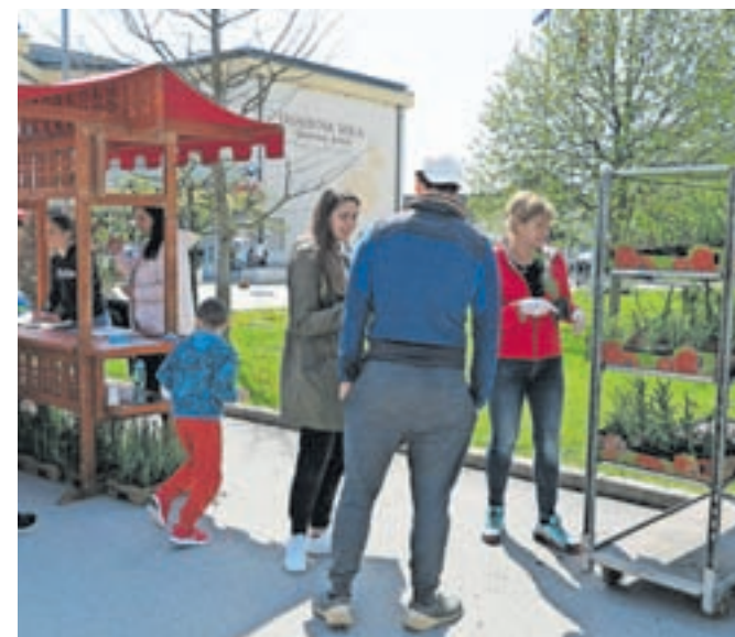
Na aprilski tržnici je Društvo kmečkih in podeželskih žena Gorenjski nagelj razdelilo tisoč sadik gorenjskih nageljnov.