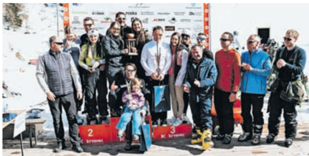
Najhitrejši predstavniki podjetij s sedežem v občini Cerklje

se jim zahvaljujemo. Še posebno smo bili veseli velikega obiska cerkljanskih otrok, saj jih je tekmovalo kar 40, upamo pa, da jih bo v prihodnje še več. Skupno 130 tekmovalcev se je pomerilo v različnih starostnih kategorijah, dodatno pa se jim je čas lahko štel tudi v razvrstitvi med podjetji ali vaškimi skupnostmi.