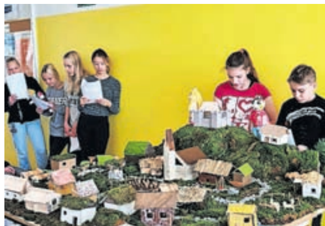
Povest o Brnekarjevem gradu je zaživela tudi v lutkovni igrici.

lavnicah klekljanja, polstenja in šole kot nekoč. Na predmetni stopnji so se učenci pogloblje seznanili s Poženčanovim delom: v okviru pritrkovalskega dne so na vadbene zvonove preigrali melodije Poženčanovih pesmi, aktivno spoznavali zvonove kot glasbilo, razvoj pritrkovanja v Cerkljah, pritrkovalske melodije in načine zapisovanja ter z iskanjem novih lastnih glasbenih idej izražali svojo ustvarjalnost. V povezavi z znano povestjo o propadu poženškega gradu so otroci izdelali maketo srednjeveške vasi z gradom in kmečkimi domačijami v okolici, povest ubesedili po svoje, jo ob pomoči lutk odigrali, nekateri pa prenesli tudi v angleški strip.