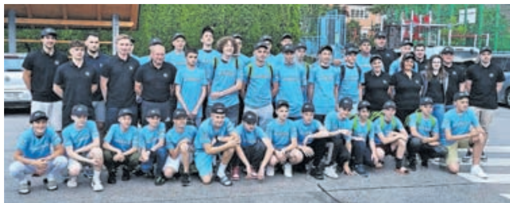
Ekipe, ki se je lani odpravila v Francijo

stopili še dve naši ekipi, in sicer Ambrož Krvavec v Amiensu, kjer bodo nastopale tudi ekipe iz Anglije, Belgije, Danske, Poljske, Nizozemske, Francije in Slovenije, ter Petrofer Mur-nik Krvavec v Wimereuxu, kjer bodo tekmovali tudi ekipe iz Francije, Kanade, Belgije, Poljske, Anglije, Nizozemske in Slovenije. Naši otroci so tudi sicer zelo zadovoljni z uvrstitvami in igrami na tem turnirju. Pravo doživetje jim pomeni druženje z vrstniki iz drugih delov sveta in spoznanje, da tudi sami dobro znajo angleško. Ob tej priložnosti bi se radi zahvalili vsem, zlasti pa staršem, sponzorjem in donatorjem, ter občanom in županu Občine Cerklje, ki nas podpirate na naši športni poti.