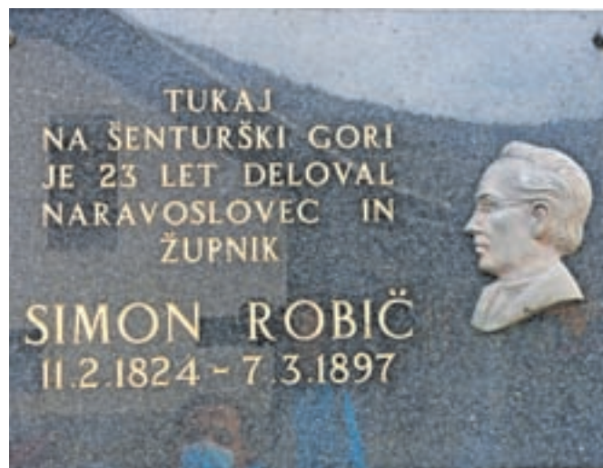
Spominska plošča duhovniku in znanstveniku je na župnišču na Šenturški Gori.

posameznih rastlinskih vrst. Zbiral je tudi minerale, odkril je Mokriško jamo in v njej popolno okostje jamskega medveda, ki ga sedaj hranijo v Prirodoslovnem muzeju v Ljubljani. Nabiral je planinske polže in med drugim odkril deset zanimivih originalov, od katerih jih je pet poimenovanih po njem. Njegova celotna zbirka mehkužcev obsega več kot 10.700 primerkov. Njegovo gradivo v mnogih primerih predstavlja osnovo zbirke današnjega Prirodoslovnega muzeja Slovenije v Ljubljani. Zaradi njegove pionirske vloge pri raziskovanju jam na področju Domžal in Moravč se je domžalsko jamarsko društvo ob ustanovitvi leta 1961 poimenovalo prav po Simonu Robiču. V njegov spomin so ob Jamarskem domu na Gorjuši pri Domžalah junija 1974 postavili doprni kip, ki je bil sploh prvi doprni kip pri nas, postavljen v čast speleologu.