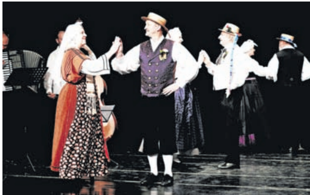
Folklorna skupina Tine Rožanc iz Ljubljane