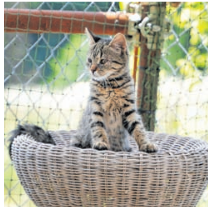
Del kvalitetne oskrbe mačke je tudi skrb za varnost.

Kapacitete Zavetišča Horjul so že nekaj časa zapolnjene, zato pri njih ostajajo le tiste mačke, ki so premajhne oziroma premlade ali prešibkega zdravja, da bi se lahko vrnilo v svoje okolje. Pomoč v