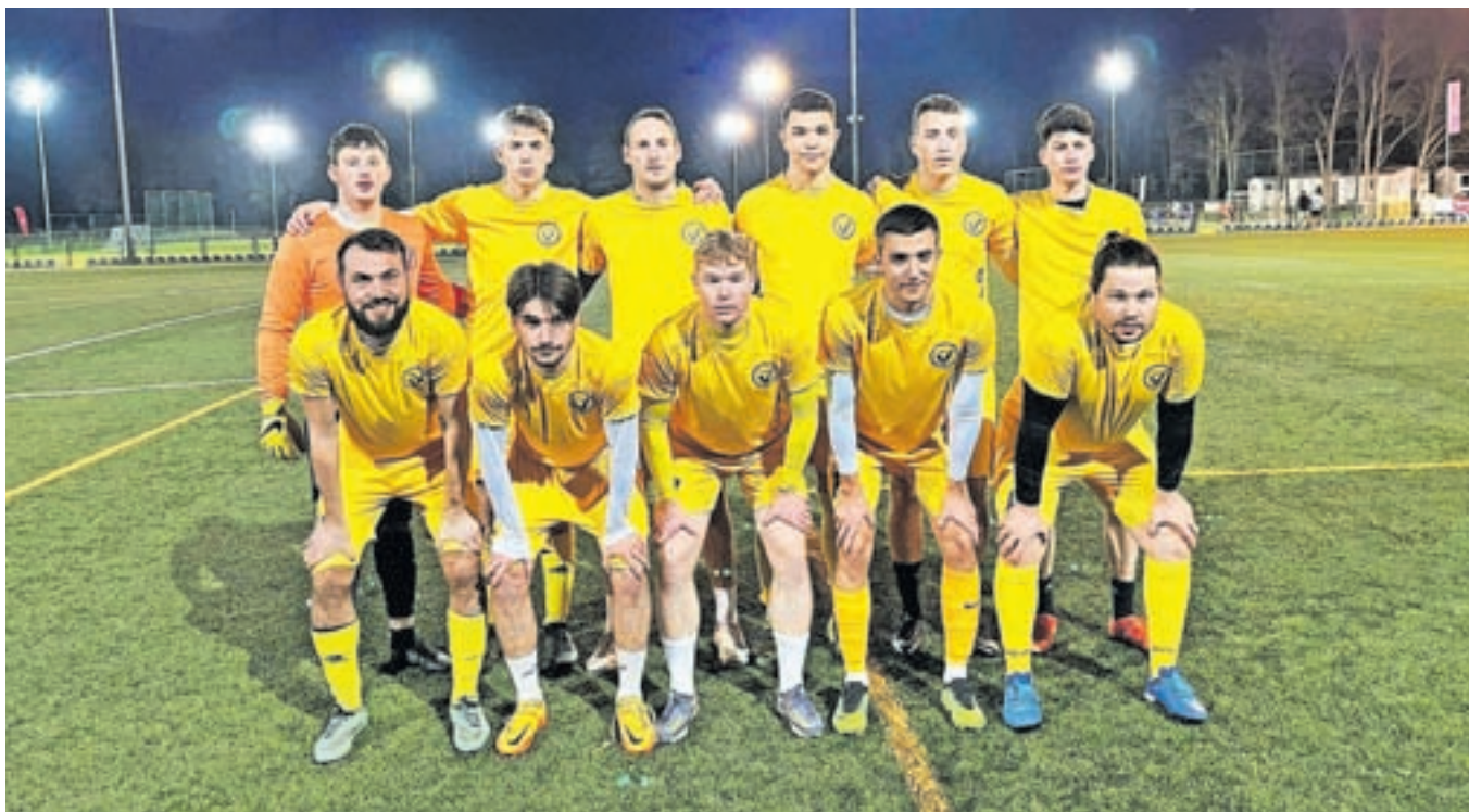
Članska ekipa NK Velesovo Cerklje, ki nastopa v Ligi za prvaka MNZ Gorenjske

Če smo po eni strani hvaležni občini za nogometni balon, ki predvsem najmlajšim nogometašem omogoča odlične pogoje skozi celotno sezono, pa se po drugi strani vse bolj srečujemo s prostorsko stisko za nemoteno treniranje in v zimskem času s pomanjkanjem terminov za starejše selekcije in člansko ekipo. Če bomo v prihodnje želeli narediti korak naprej tudi v rezultatskem smislu, bo zagotovo potrebna preureditev pomožnega igrišča in položitev umetne trave.