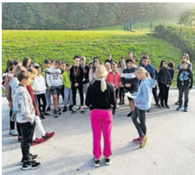
Učenci so si ogledali hriba Straža in Taber, kjer naj bi nekoč stal grad.

Učenci razredne stopnje so predvsem oživili duh časa, v katerem je živel in ustvarjal Matevž Ravninar - Požen-