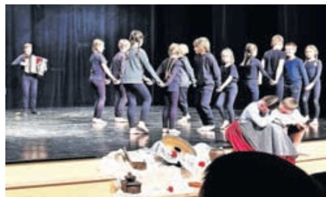
Nastop na prireditvi Skupaj se 'mamo fletno'

Ob koncu uspešnega folklornega šolskega leta nas čaka še zaslužen nagradni izlet. Obenem pa se že veselimo naslednje folklorne sezone, da se naučimo novih korakov, ljudskih pesmi in iger, ter družnja, pogostitev in številnih nastopov.