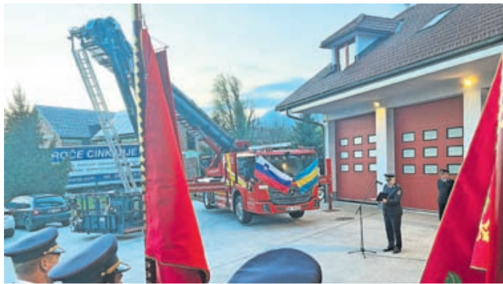
Slovesen prevzem in blagoslov gasilskega vozila, ki ima teleskopsko dvigalo z reševalno košaro