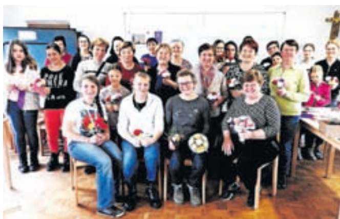
Udeleženci delavnice so bili vseh starosti.

mene narcise, tulipane, malo marjetico, žafran, nagelj in drugo cvetje. Vse so lahko odnesli domov. Izdelava papirnatega cvetja ima na Slovenskem bogato tradicijo. Pojavila se je v prvi polovici 19. stoletja, ko se je posnemanje pravega cvetja pokazalo kot nuja, saj je zaradi naravne vegetacije ob različnih letnih časih primanjkovalo naravnega rastlinja in cvetlic. Iz mest se je kasneje preneslo na podeželje, kjer se je ohranilo vse do danes.