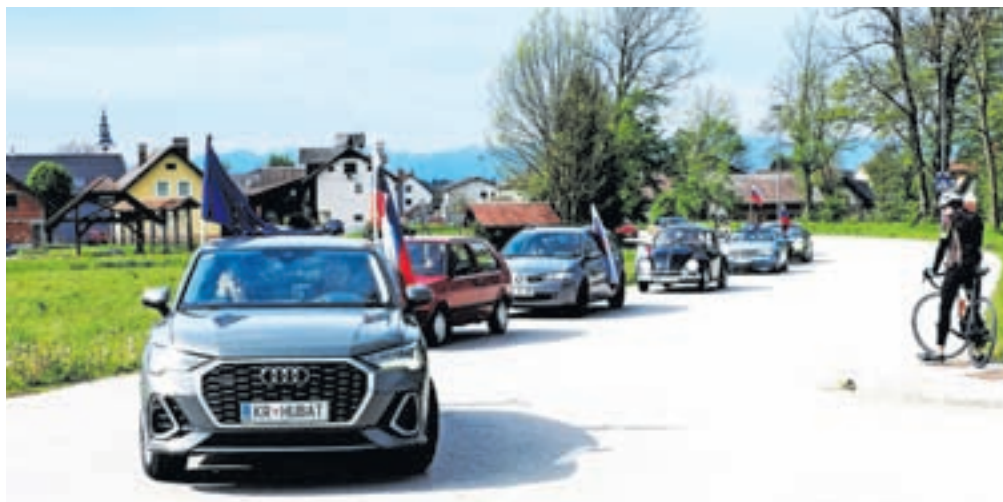
V paradni vožnji je letos sodelovalo kar 161 vozil.