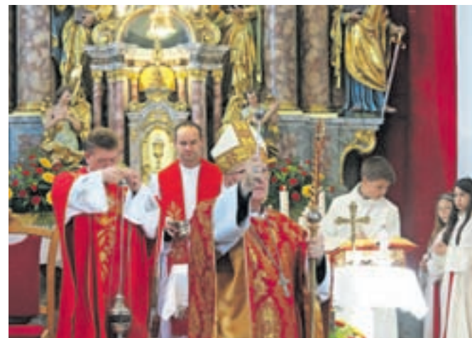
Blagoslov križevega pota v Lahovčah

V nedeljo, 7. maja, so god zavetnika gasilcev počastili tudi v podružnični cerkvi sv. Simona in Juda Tadeja na